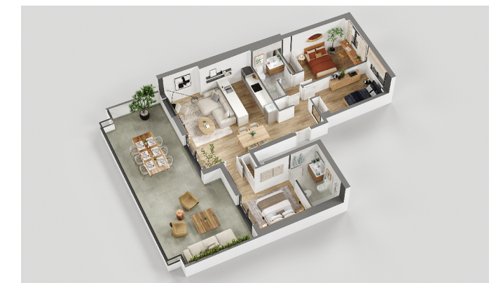
Vivienda: Planta 5 - Puerta A